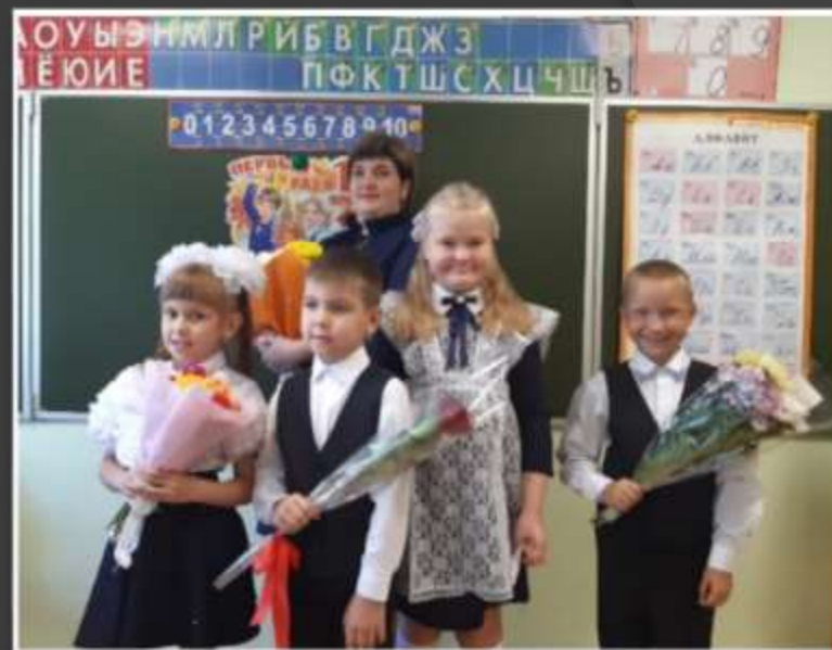
1- Б класс

Причина перевода на индивидуальный учебный план -- медицинские показания с учетом рекомендаций ПМПК и ИПР